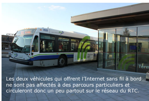
Les deux véhicules qui offrent l'Internet sans fil à bord ne sont pas affectés à des parcours particuliers et circuleront donc un peu partout sur le réseau du RTC.

Le projet pilote visant à offrir Internet sans fil à bord des autobus du Réseau de transport de la Capitale (RTC) s'est mis en branle il y a quelques jours. Jusqu'à la février, deux véhicules disposeront de l'équipement nécessaire pour offrir Internet sans fil aux usagers du transport en commun.