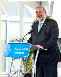
Pierre Arcand, ministre du Développement durable, de l'Environnement et des Parcs

Lundi dernier, le ministre du Développement durable, de l'Environnement et des Parcs, M. Pierre Arcand, a annoncé l'adoption d'un règlement visant à assurer une plus grande protection de la qualité de l'air par la réduction et le contrôle des contaminants atmosphériques, qui peuvent être à l'origine de smog, de précipitations acides, de pollution toxique ou de problèmes locaux de qualité de l'air. Le Règlement sur l'assainissement de l'atmosphère (RAA) concerne les secteurs industriel, commercial et institutionnel.